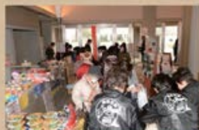
昨年も盛況だった東北物産販売