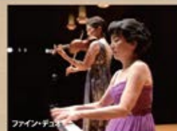
ファイン・デュオ